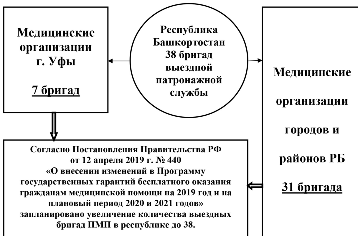
Рис.3. Структура выездных бригад паллиативной медицинской помощи для взрослого населения

Укомплектованность кадрами в амбулаторных условиях врачами ПМП - 89% (физическими ли-