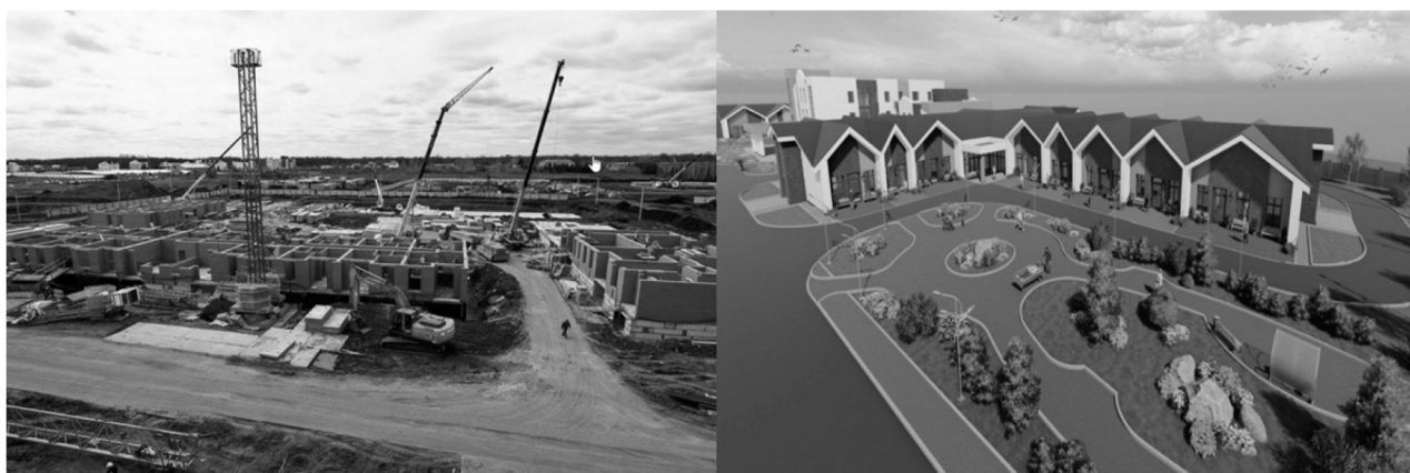
Рис. 4. Строительство хосписа в РБ

С целью повышения доступности и качества оказания ПМП населению республики оказывается организационно-методическая, консультативная и практическая помощь специалистам паллиативной медицины.